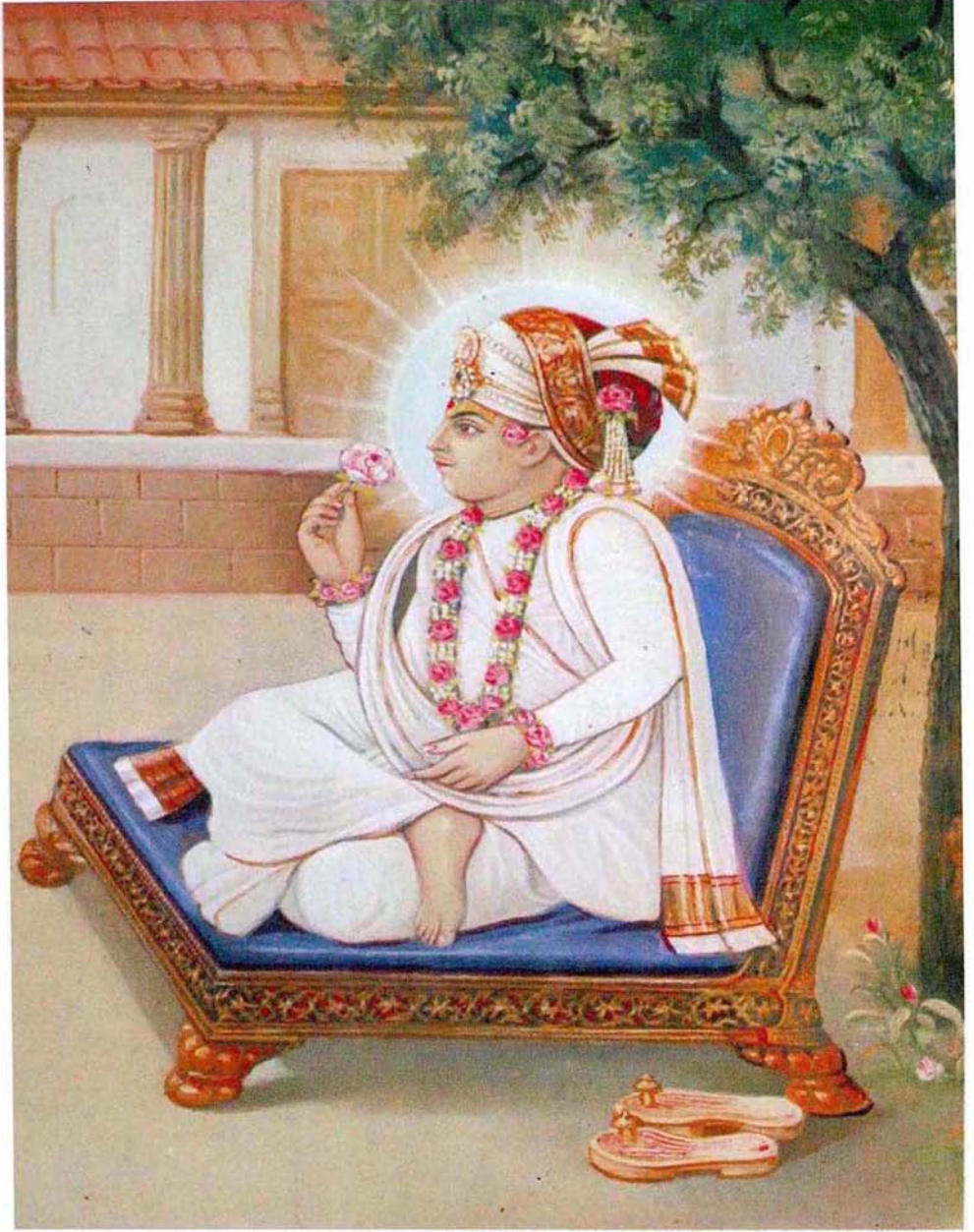
सर्वोपरी उपास्य मूर्ति पूर्ण पुरुषोत्तम श्री स्वामिनारायण भगवान